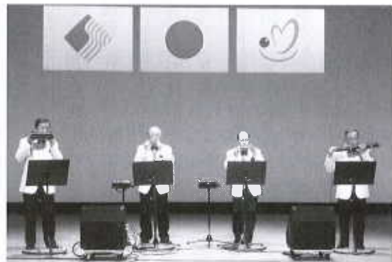
- アトラクション - ハーモニカコンサート 出演：ハーモニカアンサンブル音家の皆さん