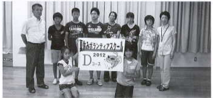
Dコース：丹原公民館（14名） 8/7～8/10