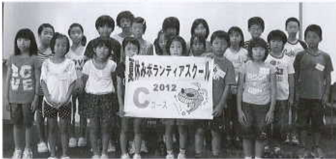
Cコース：総合福祉センター（25名） 8/7～8/10