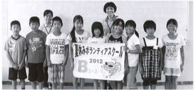
Bコース：小松地域福祉センター（12名） 7/31～8/3