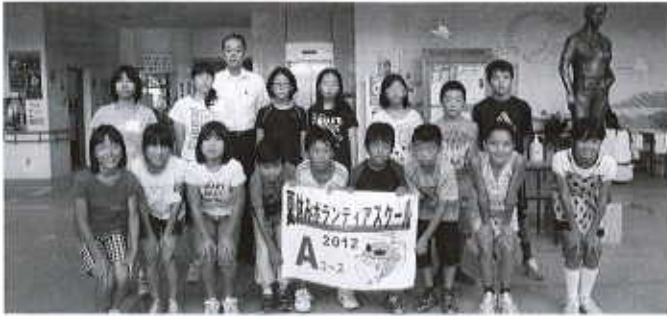
Aコース：東予総合福祉センター（21名） 7/31～8/3

夏休み恒例の、夏休みボランティアスクールを、西条、東予、丹原、小松の4会場で実施し、72名の小・中学生が参加しました。手話や点字などのボランティア体験の他、災害についての学習も行いました。