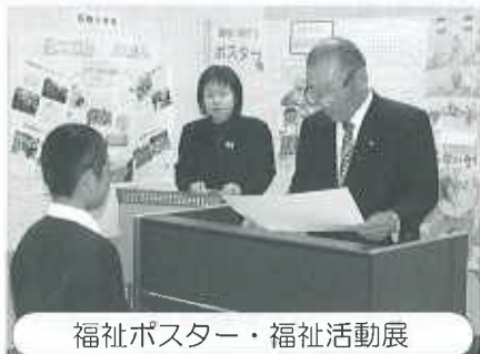
福祉ポスター・福祉活動展

この日は、天候にも恵まれ、「健康ふれあいフェスティバル」「産業文化フェスティバル」との同時開催の効果もあり、どのコーナーも多くの人で賑いました。