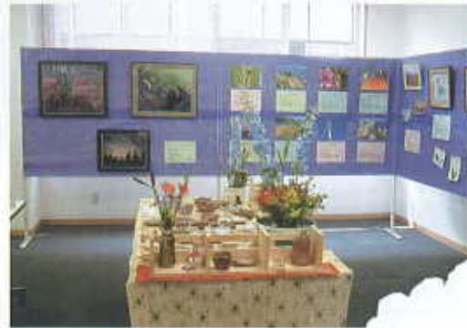
4月29日(昭和の日) 総合福祉センター