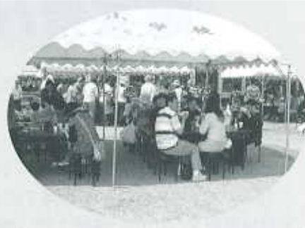
チャリティうどん

バザーでは、皆様方のご協力によって予想以上のチャリティを得ることができました。厚くお礼申し上げます。収益金は、全額社協へ寄付し、福祉のために役立てます。