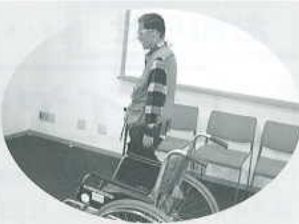
高齢者疑似体験・車イス体験