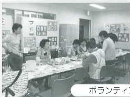
ボランティア体験・相談

市内小中学校の福祉活動に関する報告及び福祉に関するポスターの展示、優秀作品の表彰を行いました。