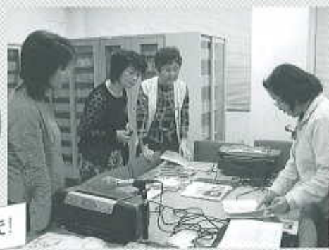
ご協力いただいたボランティアグループの皆さん、有難うございました！

ボランティア活動をされている方たちから話を聞いたり、実際にボランティアを体験してみました。