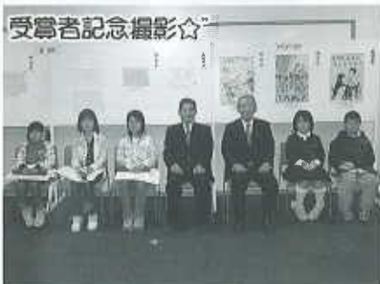
小・中学生の皆さん！たくさんのご応募ありがとうございました！みんなの中にある“やさしい心”をいつまでも持ち続けてね！※`▽`※/

第2回健康ふれ愛フェスティバル 第4回福祉フェスティバル 日時 平成十八年四月二十九日（土） 午前十時から午後三時 場所 西条市総合福祉センター