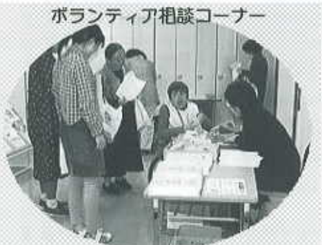
ボランティアクイズに答えて景品ゲット♪♪

ボランティア活動をされている方たちから話を聞いたり、実際にボランティアを体験してみました。