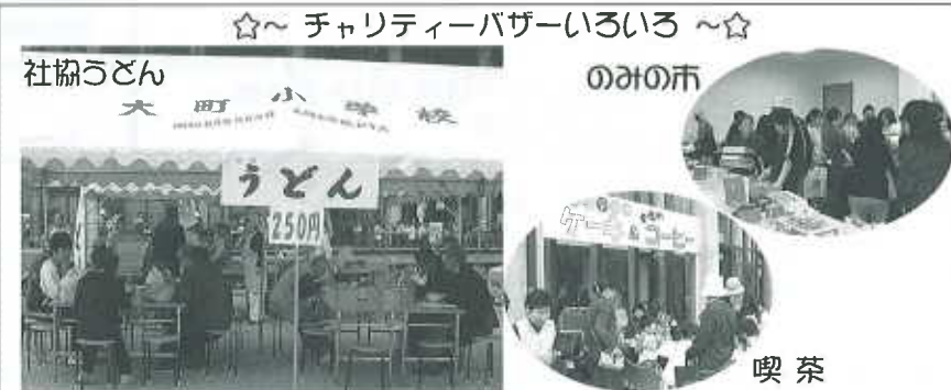
社協職員も朝からボランティア！各コーナーも大盛況～、(@`^`)/