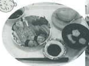
この日は “にぎり寿司バイキング♪”