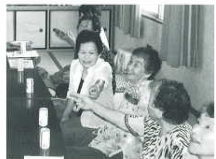
笑顔がとってもステキです！！