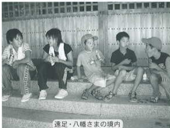
速足・八幡さまの境内