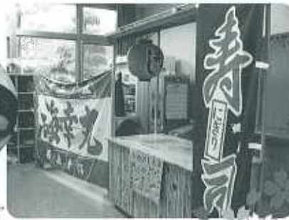
〈2ヶ月に1度の行事食〉

〒791-0531 丹原町来見乙2番地2 丹原高齢者生活福祉センター内 TEL 0898-73-2960 FAX 0898-73-2965