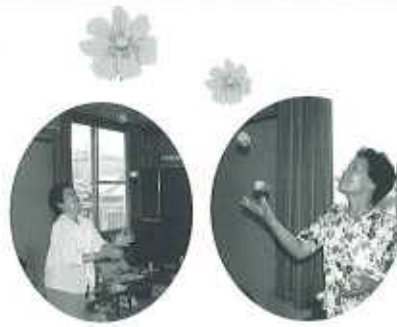
「久々のお手玉！」…みなさん大変お上手でした(^o^)/