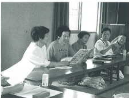
壬生川音頭をみんなで歌って、まずはウォーミングアップ♪

参加者の中には、特技をお持ちの方が何人もおられ、それを生かした内容の活動も考えておられるようでした。今後の活動がますます楽しみですね♪