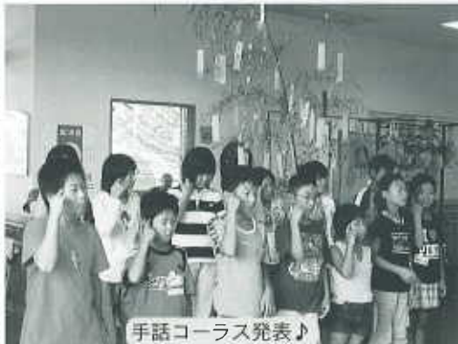
手話コーラス発表