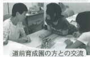
道前育成園の方との交流