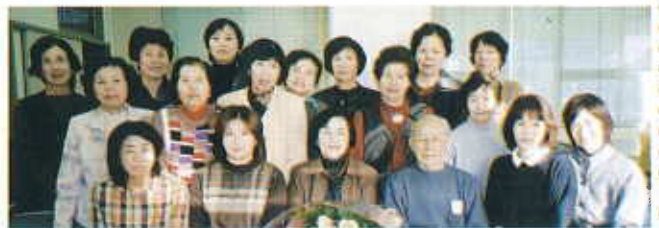
朗読奉仕員養成講座に参加して