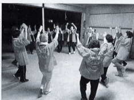
飯岡地区 いきいきサロン ドンパンクラブ

男性も一緒に食事の準備をしています。参加者全員が得意なことを活かしながら楽しまれ、地域の情報交換の場にもなっています。