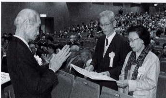
ダイヤモンド婚頭彰