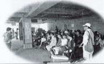
災害ボランティアセンター設置・運営