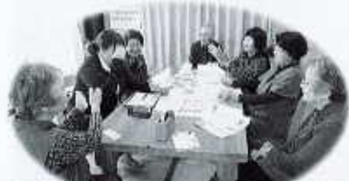
ふれあい・いきいきサロン