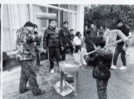
大町地区 月曜ふれあいサロン

空き倉庫を活用して、盆踊りをしています。盆踊りを通して体力づくりを行い、夏には他の地域にも踊りに行き、交流を深めています。