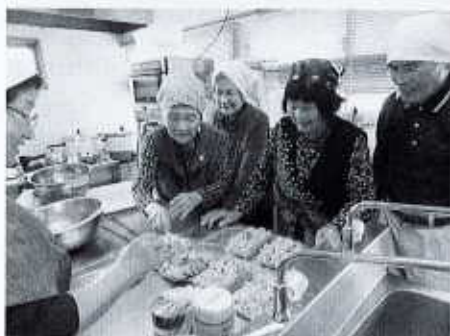
多賀地区 北条新田フジサロン

男性も一緒に食事の準備をしています。参加者全員が得意なことを活かしながら楽しまれ、地域の情報交換の場にもなっています。