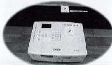
共同募金配分金特別事業