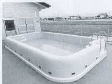
夏が待ち遠しくなるプール