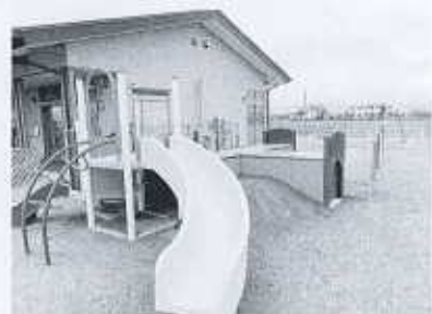
子どもたちに一番人気の遊具