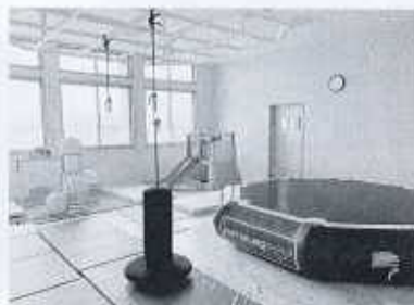
大きな遊具のあるお部屋