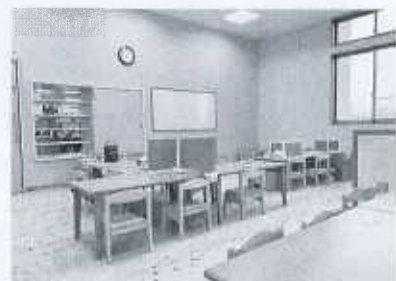
給食がおいしいランチルーム