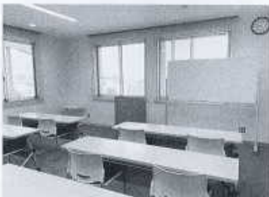
30名ほどが利用できる研修室