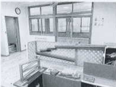
様々なコーナーのあるお部屋