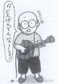
「初出：ペコロスの母に会いに行く」

本大会を契機として、共に支え合う福祉のまちづくりに向けて新たな一歩が踏み出せたと思います。