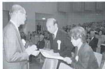
顕彰状授与の様子 (第13回西条市社会福祉大会において)