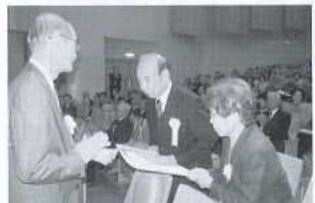
顕彰状授与の様子 (第13回西条市社会福祉大会において)