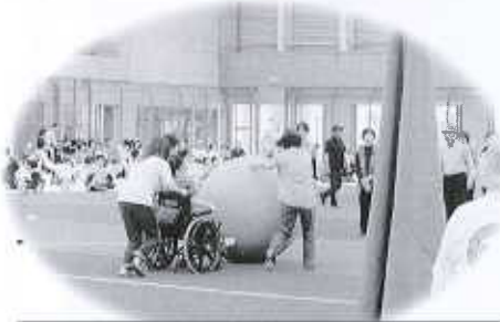
ふれあいの運動会