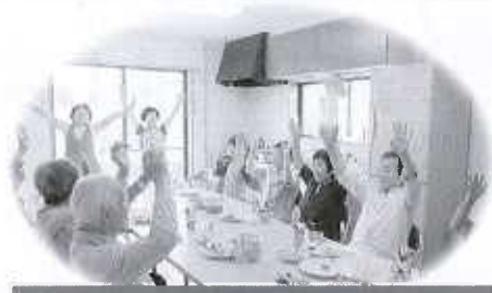
ふれあい・いきいきサロン