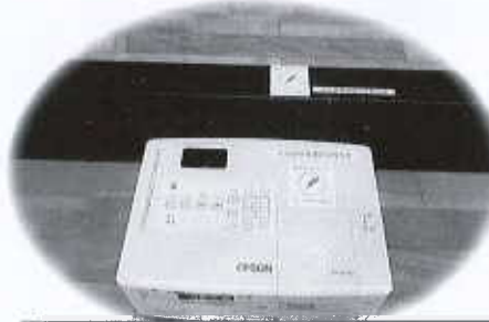
共同募金配分金特別事業

皆様からご協力いただいた赤い羽根共同募金は、これらの事業の他にも、障害者社会参加促進事業や、ボランティアセンター運営事業など、西条市をよくする活動に活かされています。