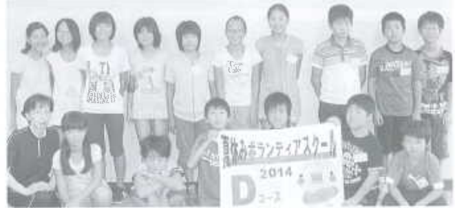
Dコース：小松公民館、小松地域福祉センター(16名) 8/5～8/8