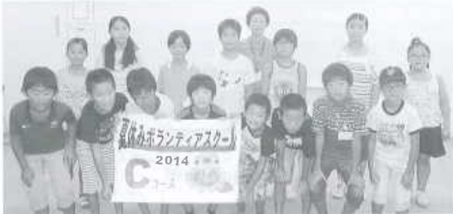
Cコース：丹原公民館(15名) 8/5～8/8