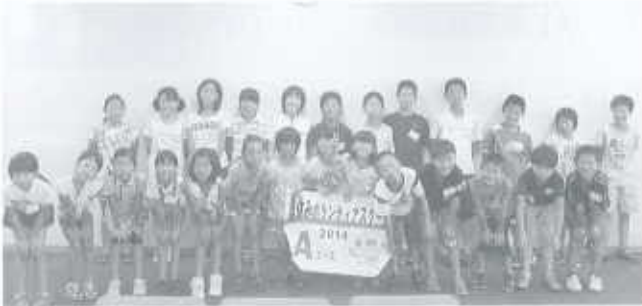
Aコース：総合福祉センター(26名) 7/29～8/1

今年度も下記の日程で実施し、75名の方にご参加いただきました。異年齢の子どもたちが共に助け合いながら、活動体験をすることで、たくさんの学びが得られたようです。