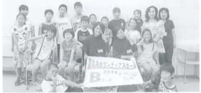
Bコース：東予総合福祉センター(18名) 7/29～8/1