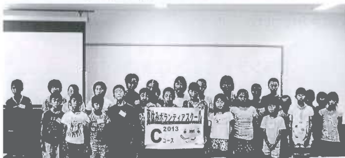
Cコース：総合福祉センター（28名） 8/6～8/9