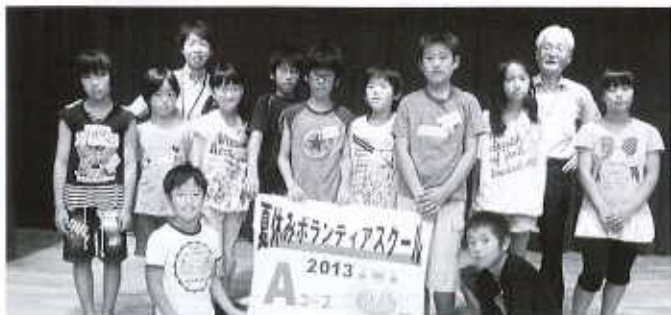
Aコース：丹原公民館（11名） 7/30～8/2

夏休み恒例のボランティアスクールを、西条、東予、丹原、小松の4会場で実施し、68名の小・中学生が参加されました。手話、点字、要約筆記、朗読、車イス介助などたくさんのボランティアを体験し、たくさんの学びが得られたようです。