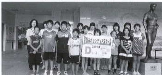
Dコース：東予総合福祉センター（16名） 8/6～8/9