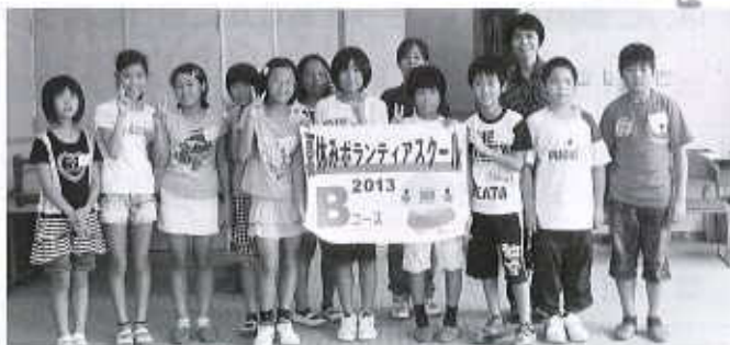
Bコース：小松地域福祉センター（13名） 7/30～8/2