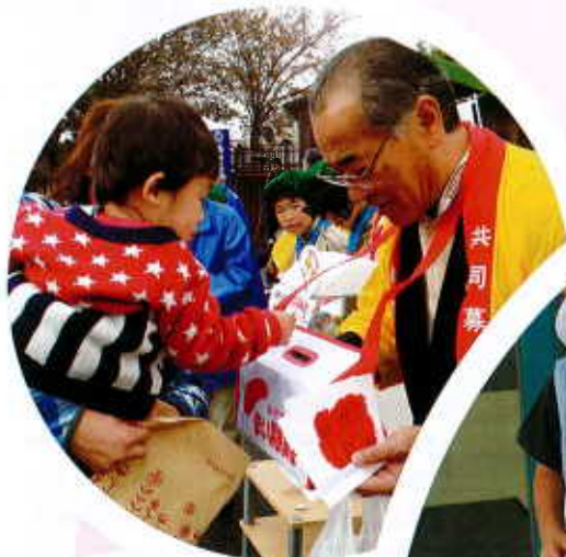
写真:平成24年度 街頭募金

編集・発行 社会福祉法人 西条市社会福祉協議会 〒799-1371 西条市周布606-1 東予総合福祉センター内 TEL 0898-64-2600(代表) 0898-65-5365(直通) FAX 0898-64-3920 http://www.saijoshakyo.or.jp/