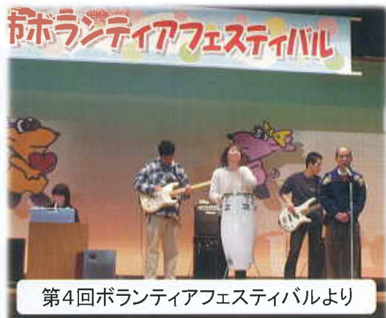
第4回ボランティアフェスティバルより