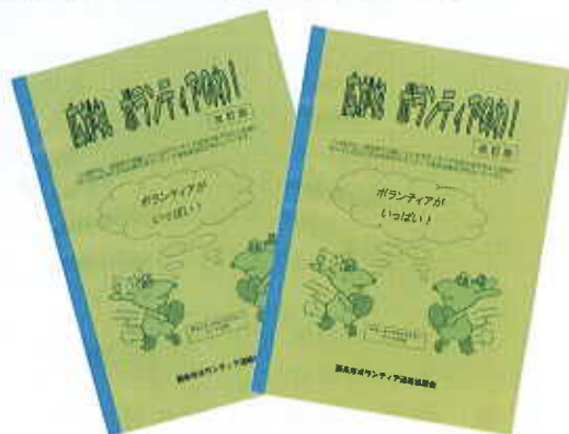
ボランティア冊子 “広がれ ボランティアのわ！” （改訂版）

※この冊子は、ボランティアセンターにて無料でお渡ししています。お気軽にお問い合わせ下さい。