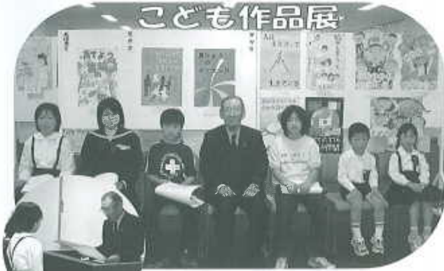
表彰式 こども作品展優秀作品表彰式のあと、みんなで記念撮影。～ハイッ・チーズ！(´▽`)ノ

西条市の産業文化フェスティバル・健康ふれあいフェスティバルとの同時開催で、天候にも恵まれ会場は大勢の人でにぎわいました。