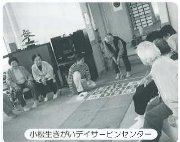
小松生きがいデイサービスセンター

それぞれの地域で、いろいろなレクリエーションなどを行い、皆さんに喜んでいただいています。利用者の方々は、毎回デイサービスに来るのを楽しみにしています。