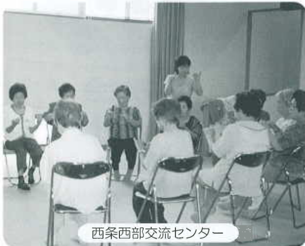
西条西部交流センター

皆さんがいつまでもお元気で、楽しんでいただけるよう、ご利用をお待ちしています！！