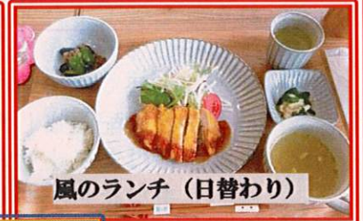
風のランチ (日替わり)