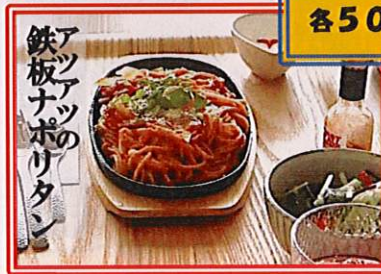
鉄板アツナツのポリタン