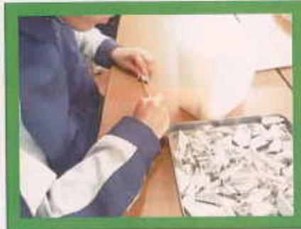
磁石とゴムパーツをはずす作業も慣れた手つきで行なわれています。