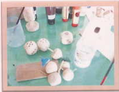
インテリア用のサイコロや雪だるまを木で製作中。