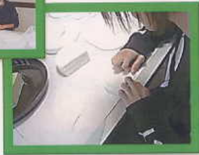
フェイスマスクを畳む作業です。一枚一枚きれいに積み重ねられています。