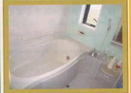
お風呂は外作業で汚れた時などに使用されるそうです。