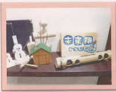
入口に展示販売されていた可愛くて温もりのある木工作品です(^_^)