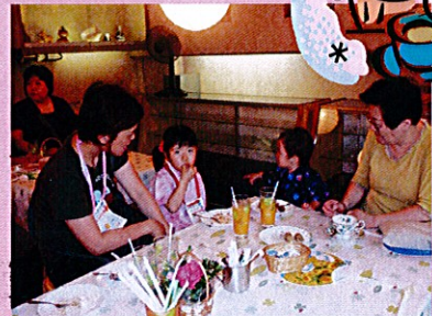
出張喫茶店内の様子

ボランティア団体としての「ハーモニー♪」は、旧西条市に本拠地を置き、会員が6名とメンバーが3名、驚きは賛助会員が50名にも達していることです。イベントの時は、20人くらいで活動しているとのこと。私は今日初めてお邪魔しましたが、多くの方が次々と来店する様子に、これまで地道な活動を続けてこられたことが伝わってきました。私達も「ハーモニー♪」に心からエールを送りたいと思います。(梅野)