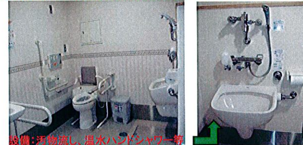
設備：汚物流し、温水ハンドシャワー等