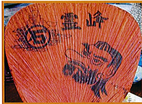
国安の和紙と丹原の柿渋を使用した渋うちわ

また、第2火曜日はスポーツの日(小松運動公園)、第4木曜日は編み物教室(小松公民館)、新居浜市のイオン等で買い物の実習にも力を入れているそうです。