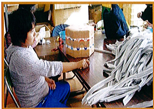
冷蔵庫パッキン(ホルダー)のリサイクル作業

今後は、国安の和紙と丹原の柿渋を使用した「渋うちわ」制作やネット販売にも力をいれていきたいと思っているそうです。