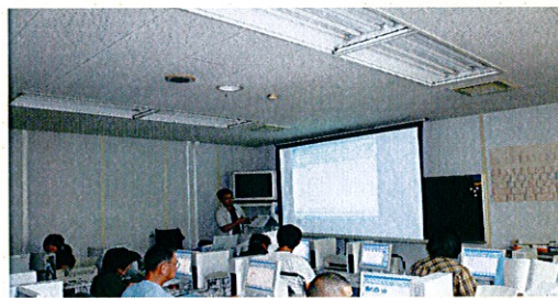
講習会の様子(中央公民館)

僕は、ラスト2回の講師を担当しました。原稿や資料などは、実際は直前まで作成していました。短い時間で何を話すのがベストなのかは、思いのほか悩みました。僕は精神障害で体が動くので、黒板を多用してみました。これは楽しかったです。その瞬間に思いついたことでも、大勢の人に伝える手段としては、最高だと思いました。ちょうど学校に「電子黒板」を入れるとかニュースで聞きますが、「電子」でないほうが面白みがあると思ったりしました。難しい理論を、いかにわかりやすく説明するかという面では、僕自身も勉強になりました。何より、あの教室にいた全員の雰囲気は、すごく良かったと思います。