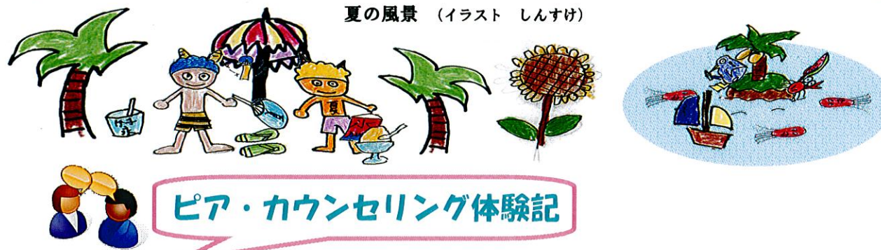
夏の風景 (イラスト しんすけ)

機関紙オンリーワン、第2号の発行です。まだまだ暑い日が続いていますが、みなさんいかがお過ごしでしょうか。7月・8月は、各種団体の夏祭りや福祉プール、キャンプでにぎわい、多くの方が参加され夏の楽しい思い出を作られたのではないのでしょうか。支援センターも、7月26日(土)石鎚ふれあいの里にて第1回交流パーベキュー大会を行い、障害をお持ちの方やボランティアさんなど36名の方が参加してくれました。「外でみんなと一緒に食べるとおいしいね!!」と言ってくれた方がいましたが、まさにそのとおり！自然の中で楽しいひと時をすごせました。