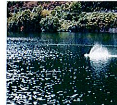
♪水と緑豊かな朝倉ダム♪