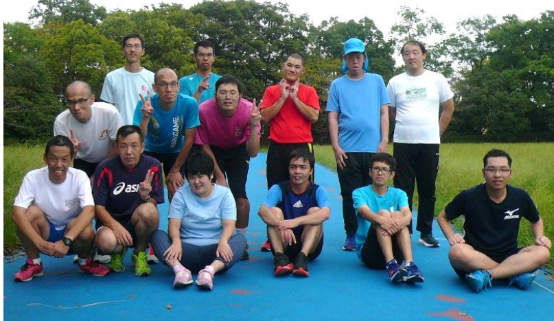
西条ブランチのアスリートの皆さん。スペシャルオリンピックスでは、スポーツ活動に参加する人達をアスリートと呼びます。

スペシャルオリンピックスとは、知的障がいのある人達に様々なスポーツトレーニングとその成果の発表の場である競技会を、年間を通じ提供している国際的なスポーツ組織。4年毎に世界大会が開催される。愛媛には、西条ブランチの他、松山東温ブランチ、新居浜ブランチ、今治ブランチがあり、バドミントンやボウリング、水泳等の活動をおこなっている。