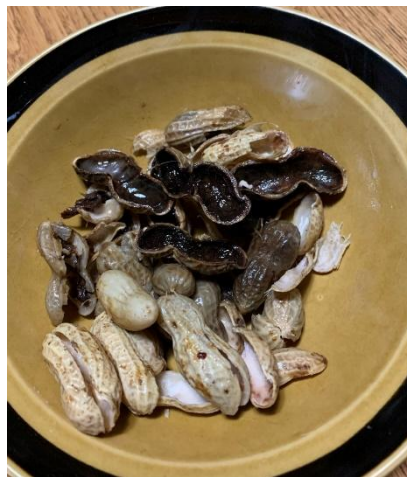
黒くなった落花生