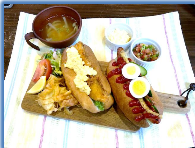
【ホットドッグメニューの昼食です】

マーカバステーションは就労継続支援 B 型・生活介護の多機能事業所として令和3年6月に開所しました。