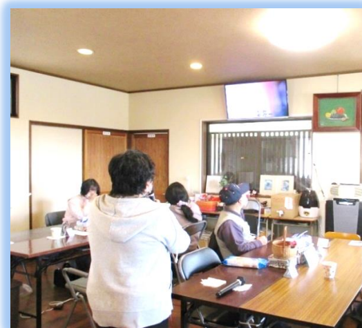
【みんなでカラオケを楽しまれています】

看護師が在籍し、日々のバイタルチェックや健康相談など体調面をサポートする体制を整えています。