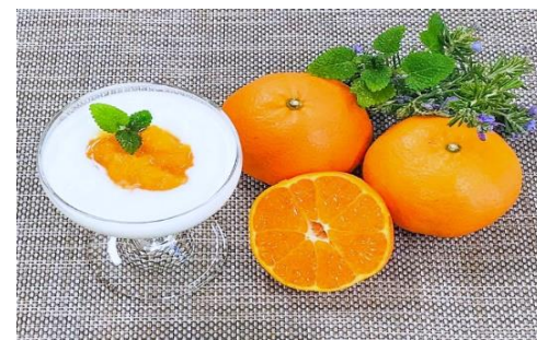
ヨーグルトと一緒に食べるのもオススメです

事業所では、愛媛県で採れた新鮮なフルーツや野菜を使用したジャムなどの製品を作っています。販売はオンライン限定です。愛媛県産の「せとか」を贅沢にマーマレードにしました。「せとか」は、とろりととろける食感とジューシーな味わい、みずみずしいオレンジの香りが特徴的なみかんの品種です。ほどよい酸味とさわやかで濃厚な甘味をご堪能ください。